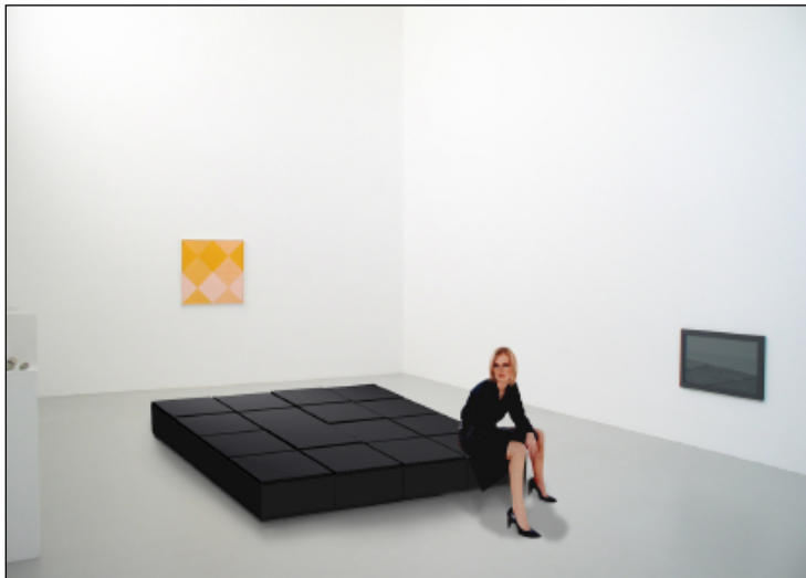
^ Illustrations par VTOL-Design.